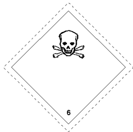
Rótulo Peligro Principal