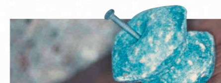
Nuevos cebos fáciles de fijar, con un porcentaje de éxito sin precedentes