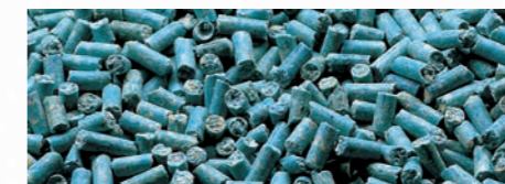
La fórmula ideal para erradicar cualquier plaga de roedores