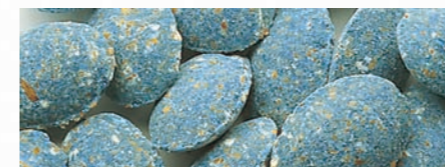
Cebos para ratas y ratones de eficacia probada, Indicados también para lugares húmedos