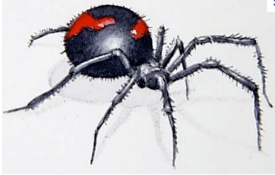
ARAÑA DE TRIGO