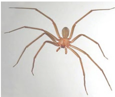
ARAÑA DE RINCON