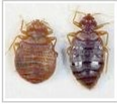
El chinche de cama Cimex lectularius